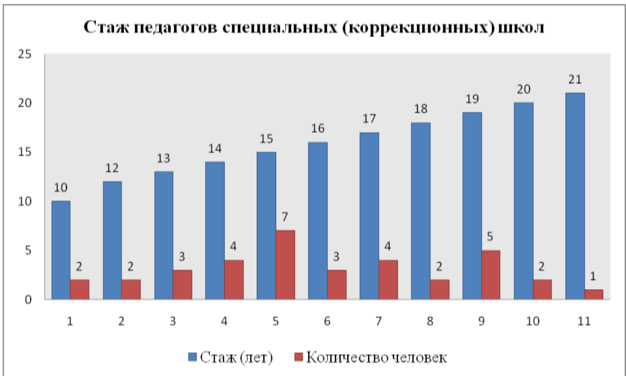
Рис. 1. Стаж педагогов специальных (коррекционных) школ