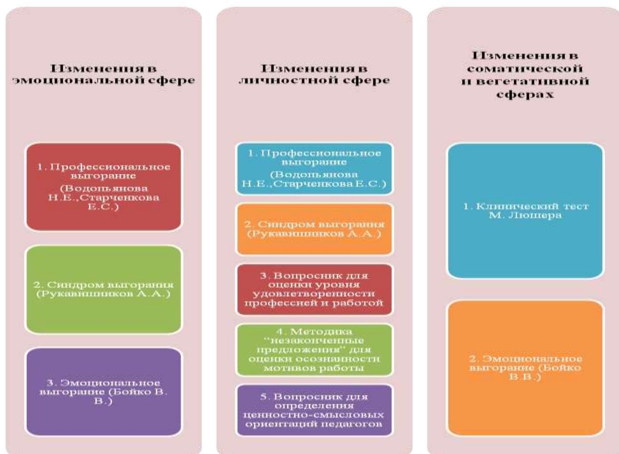
Рис. 6. Методики исследования

В ходе исследования, для измерения изучаемых характеристик был использован ряд методик, перечень которых отражен на рисунке 6.